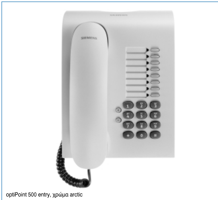
optiPoint 500 entry, χρώμα arctic