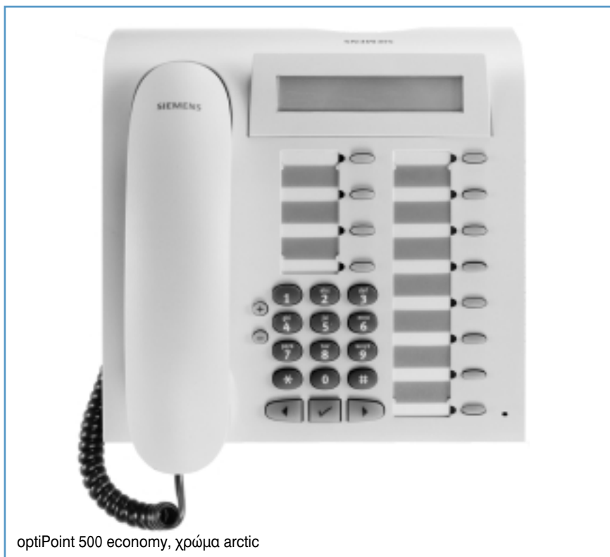
optiPoint 500 economy, χρώμα arctic