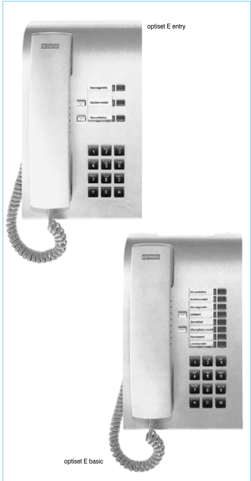
optiset E entry

Μπορούν να ενεργοποιηθούν πρόσθετες δυνατότητες με τη χρήση κωδικών.