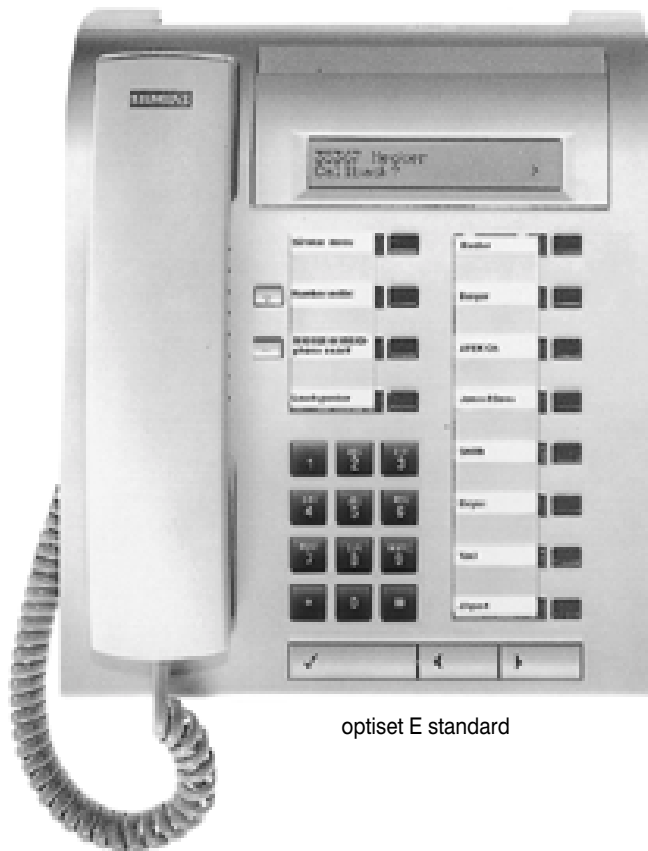
optiset E standard