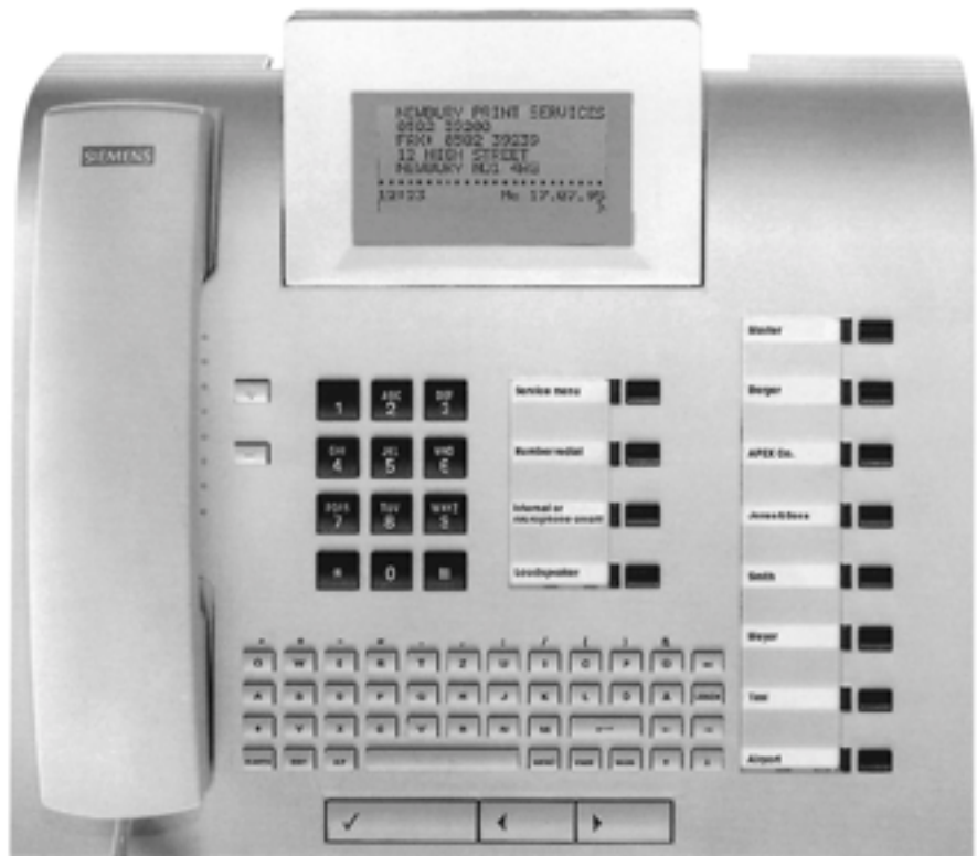
optiset E memory