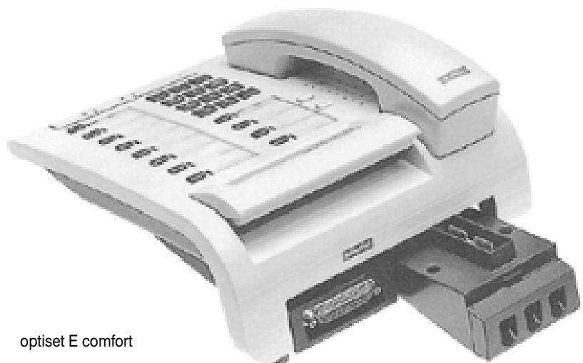
optiset E comfort